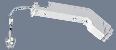
Container für Hohlraumdecken

Miniatur-LED-Sicherheitsleuchte zum Einbau in offen zugänglichen Hohlraumdecken mit einem oder zwei Containern oder Einbau in Allgemeinleuchten/Lichtschienen aus Aluminium, rund, Leuchtenkopf IP54, sichtbarer Durchmesser 28mm, inklusive vormontierter lichtoptimierter symmetrischer Flächenoptik und austauschbarer asymmetrischer Rettungswegoptik.