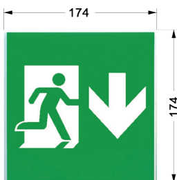
Maße Bohrabstände Decken-/Wandmontage